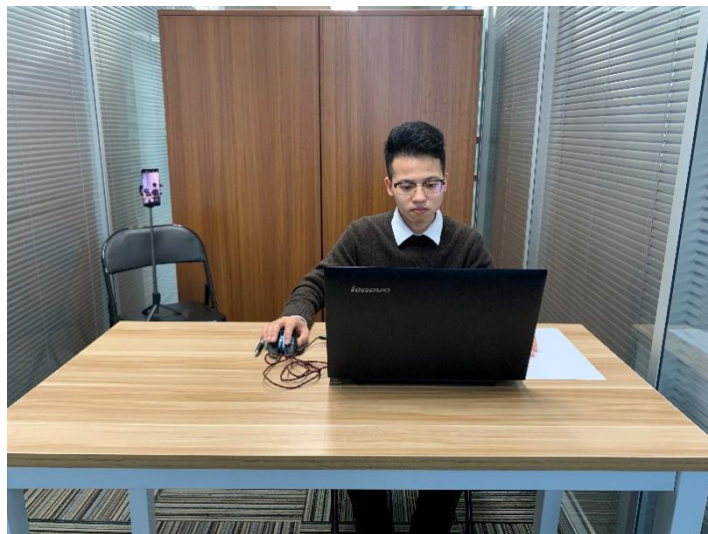
图一：电脑端正面视角

(4) 考试开始前，考生需要先登录移动端“智考通”，用前置摄像头360度环绕拍摄考试环境，随后将移动设备固定在能够拍摄到考生桌面、考生电脑屏幕内容、周围环境及考生行为的位置上继续拍摄（详见说明书中《智考通操作手册》《智考云在线考试规范》）。