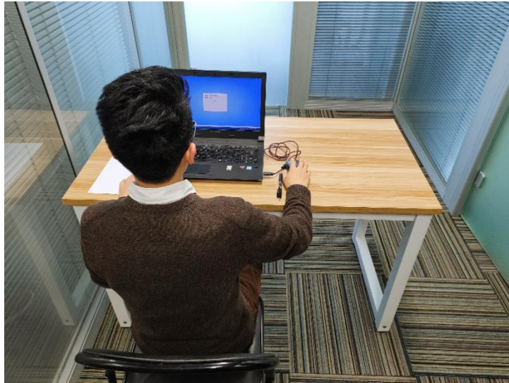
图二：电脑端背面视角